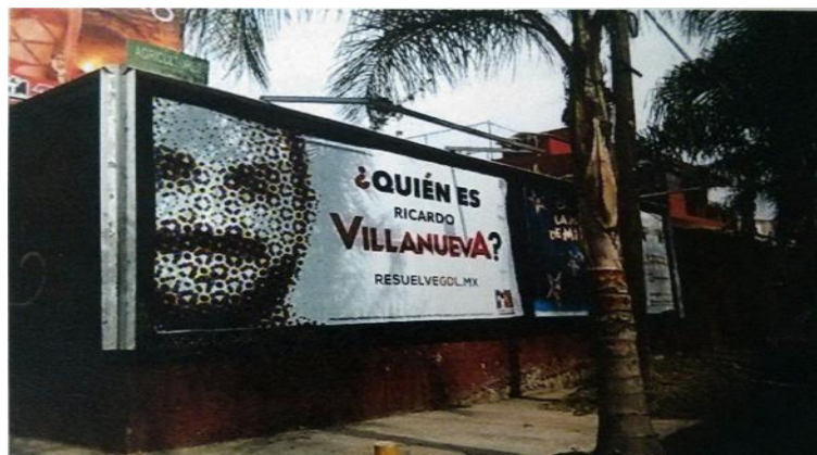
Avenida Federalismo Norte a su cruce con la calle Francisco Villa, en la Colonia Atemajac del Valle, Municipio de Zapopan, Jalisco.