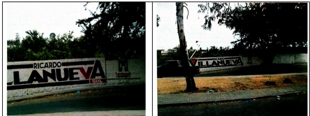
Periférico Norte Manuel Gómez Morín, a un costado del número 1710, en la Colonia San Miguel de Huentitán, Municipio de Guadalajara, Jalisco.