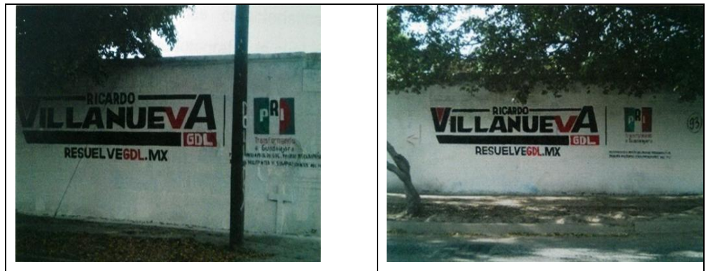
Calle Agricultores, en la Colonia Arcos de Zapopan, Municipio de Zapopan, Jalisco.