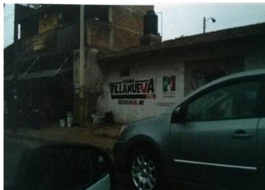
Avenida López Mateos Norte, en la colonia Circunvalación Américas, Municipio de Guadalajara, Jalisco.