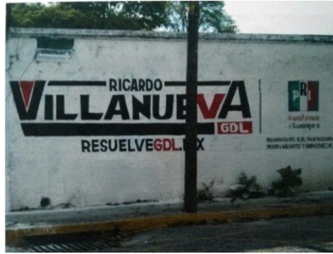
Avenida López Mateos Norte entre las calles Colomos y Venecia, en la Colonia Italia Providencia, Municipio de Guadalajara, Jalisco.