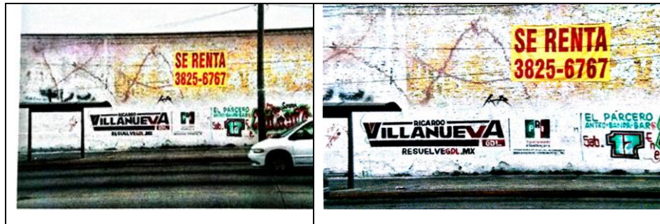
Avenida de la Selva Norte a su cruce con el Periférico Norte Manuel Gómez Morín, en la colonia Santa Cecilia, Municipio de Guadalajara, Jalisco.