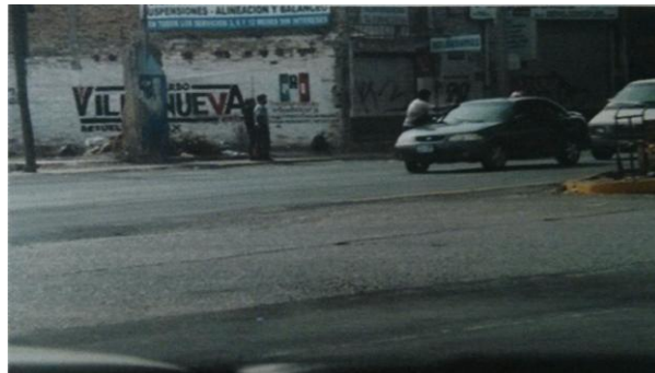
Calle Isla Antigua a su cruce con la Avenida Patria, en la colonia Jardines el Sur, Municipio de Guadalajara, Jalisco.