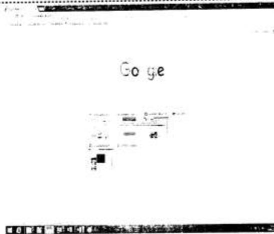
Foto 1: En la cual se puede observar la descripción detallada anteriormente. -----

Para mejor ilustración, se adjuntan las fotografías siguientes: -----