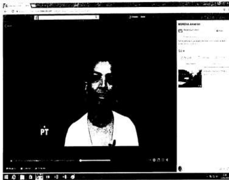
Foto 4: Para mejor ilustración, se adjunta la fotografía siguiente:-----

Finalizando el citado video aparece la siguiente imagen que presenta en letras rojas la palabra “morena”, debajo de ella en letras negras “movimiento regeneración nacional”, debajo de estas palabras se observan palabras en color rojo que dicen “Amatitán”, debajo de ella se presenta la imagen con letra color rojo que dice “Morena”, a su lado derecho la letras “PT” color amarillo con fondo rojo, a la derecha de estas la palabra “Encuentro Social” en gris, se pueden percibir todos estos elementos en un fondo blanco, en esta imagen se escucha una voz masculina que menciona lo siguiente “Juntos haremos historia Morena Amatitán”: -----