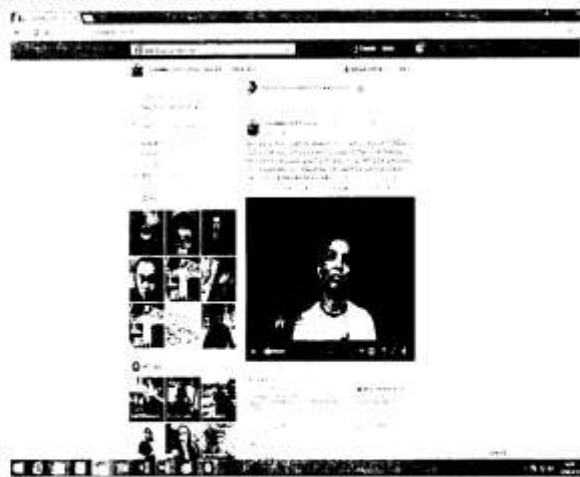
Página 8 de 11

Foto 3: Para mejor ilustración se adjunta la imagen detallada: -----