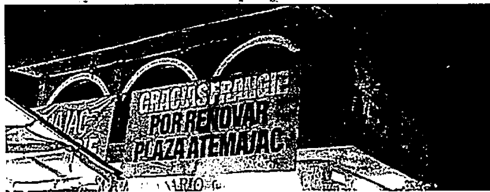
A continuación observo, una lona de aproximadamente cuatro por dos metros, que se encuentra fijada